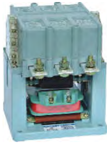
· 辅助电路的触头种类，数量及基本参数见表4